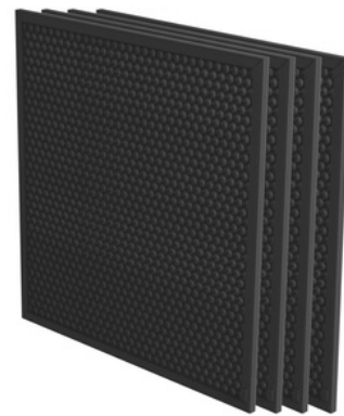
Fibre de carbone