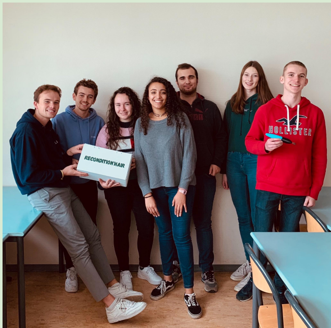
Association de bénévoles nommée "Collec'Tif"

Notre ambition: sensibiliser la génération future au recyclage et à l'environnement.