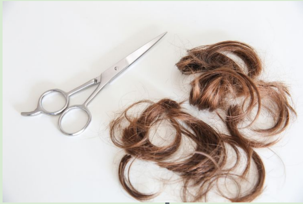
Cheveux à recycler